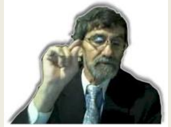
Por Eliyahu BaYona