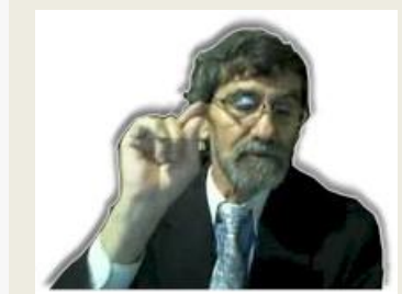
Por Eliyahu BaYona

Un rey tenía un solo hijo que se enfermó.