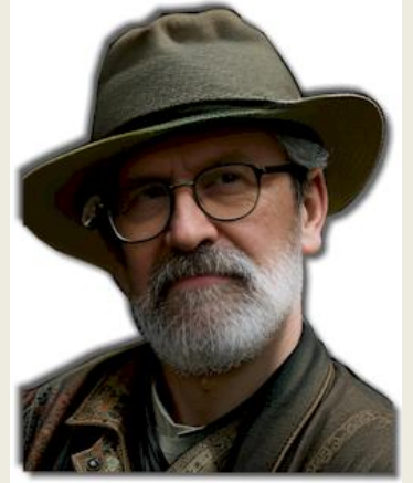
Por Eliyahu BaYona

"Los caraítas dependen de las observaciones del primer día del mes del calendario hebreo, cuando la luna creciente hace su primera aparición.