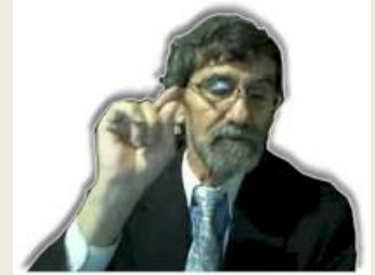
Por Eliyahu BaYona

Comer santo nos hace santos, razón por la cual las leyes de kashrut (kosher) se explican extensamente en la Torá y en los comentarios.