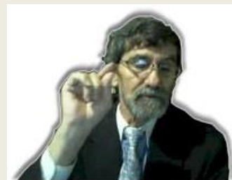
Por Eliyahu BaYona

Con este entendimiento, exploremos cada uno de los elementos en la Mesa de la Pascua.