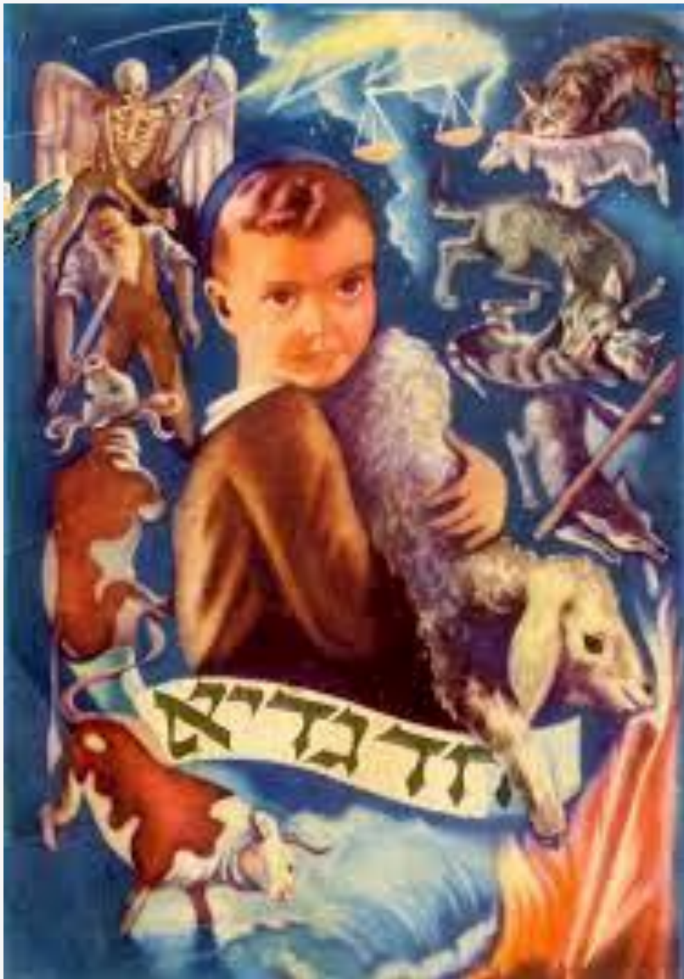
Had Gadya Sefardí en Ladino

Aquí hay 10 tradiciones de Pascua menos conocidas de todo el mundo.