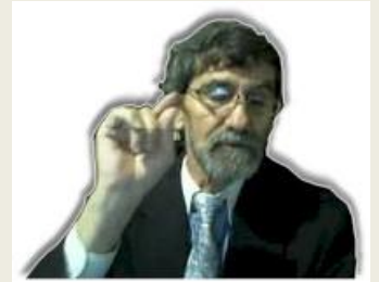
Por Eliyahu BaYona