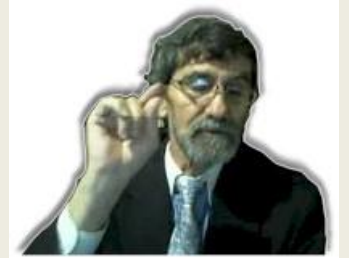
Por Eliyahu BaYona

Antes de los 13 años es un Katán, un menor. Después, es un Gadol.