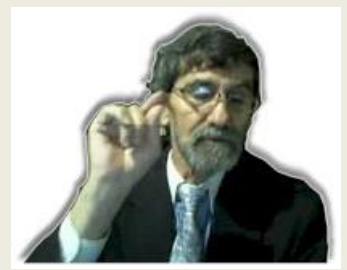
Por Eliyahu BaYona

También se le pidió a Israel que ofreciera sacrificios en sus días sagrados. (Números 28,4, "observarás que debes hacer, cada día a su hora señalada").